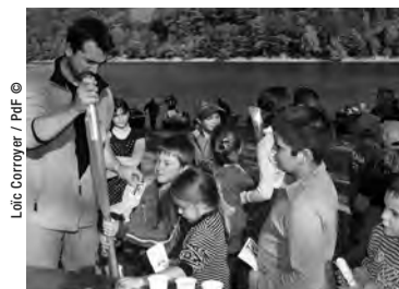
APRÈS AVOIR RENCONTRÉ DANS LE CADRE DU CHALLENGE, 180 ÉLÈVES PENDANT UNE SEMAINE, LES ANIMATEURS ONT RETROUVÉ 80 FAMILLES À CABANAC, À L'OCCASION DE LA REMISE DES LOTS. UN VRAI SUCCÈS !