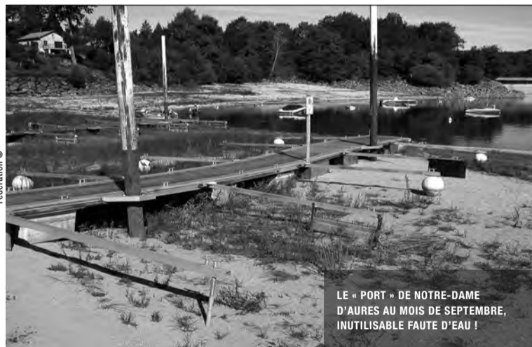
LE « PORT » DE NOTRE-DAME D'AURES AU MOIS DE SEPTEMBRE, INUTILISABLE FAUTE D'EAU !