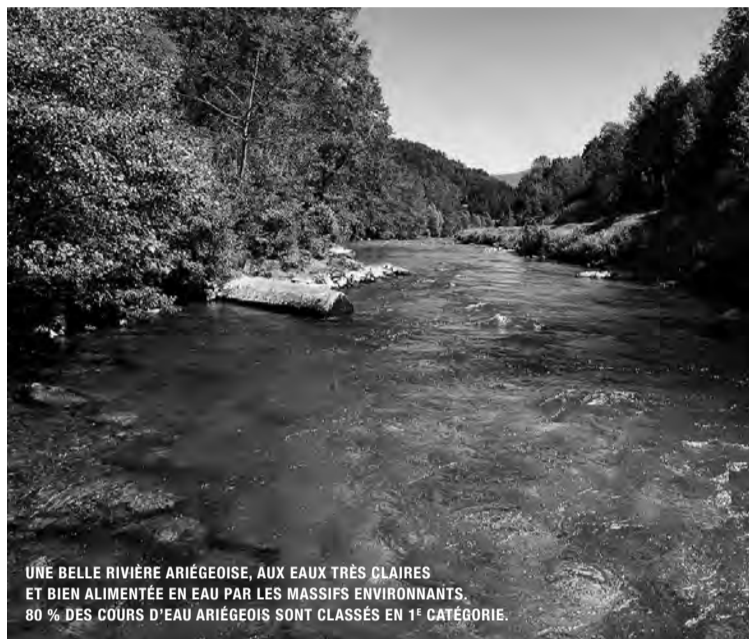
UNE BELLE RIVIÈRE ARIÉGIOISE, AUX EAUX TRÈS CLAIRES ET BIEN ALIMENTÉE EN EAU PAR LES MASSIFS ENVIRONNANTS. 80 % DES COURS D'EAU ARIÉGIOIS SONT CLASSÉS EN 1 È CATÉGORIE.

Plus sérieusement, en respectant quelques consignes simples comme celles de bien assurer le maillage des dépositaires sur le département, de bien les accompagner, de bien faire savoir aux aveyronnais que la carte peut s'acheter de chez soi, mais aussi chez son détaillant habituel, les AAPPMA ne rencontreront aucune difficulté majeure, n'y verraient que des avantages et prieront, comme leurs consœurs ariégeoises, pour ne pas revenir en arrière.