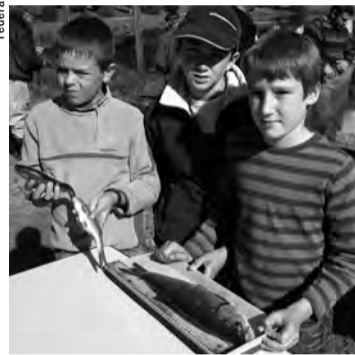
DE JEUNES PÊCHEURS TRÈS IMPLIQUÉS !

D'où ce projet audacieux de dérivation, qui doit apporter un gain thermique pour le secteur aval de l'Argence. Toutefois, au cas où la dérivation serait possible, il est bien clair que les plans d'eau ne doivent pas cesser de fonctionner biologiquement. C'est pourquoi la première opération consistera à faire le diagnostic des retenues, dont se charge le bureau d'études « IDEAUX », spécialiste des « eaux mortes ».