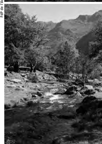
RUISSEAUX ARIÉGIOIS D'ALTITUDE, QUI DEMANDENT AUX PÊCHEURS DES EFFORTS POUR Y ACCÉDER. MAIS QUEL PLAISIR UNE FOIS SUR PLACE !

carte à durée de validité courte (vacances et/ou journalière). La pêche associative doit s'adapter à ces nouveaux modes de consommations de notre loisir, une des réponses réside dans la labellisation de parcours afin de guider les pêcheurs vers les produits qu'ils recherchent pour ensuite les fidéliser. Néanmoins, la pêche associative tire sa force de son caractère populaire, la pêche dite "moderne" ne devra pas oublier que la convivialité entre les différents types de pêcheur est un des socles principaux de l'associatif pêche. D'ailleurs, un pêcheur "moderne" utilisant les techniques de pêche les plus pointues, connecté en ligne sur les sites de mesures en temps réel de débit des cours d'eau, de météo, sur les forums de pêche pour glaner les dernières infos sur l'activité des poissons, etc., n'est-il pas, finalement et par certains côtés, à la recherche de l'efficacité du pêcheur rustique ?