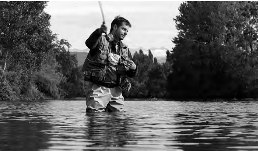
APRÈS AVOIR DÉVALÉ DES MONTAGNES, LES RUISSEAUX ET LES TORRENTS ARRIVENT EN PLAINE POUR Y FORMER DES RIVIÈRES, OÙ LES COURANTS ALTERNENT AVEC DES ZONES PLUS LENTES. C'EST LE CADRE IDÉAL POUR LE PÊCHEUR DE TRUITES. ICI UN « MOUCHEUR », EN TRAIN D'AJUSTER LA LONGUEUR DE SOIE AVANT DE PRÉSENTER SON ARTIFICIELLE.

carte à durée de validité courte (vacances et/ou journalière). La pêche associative doit s'adapter à ces nouveaux modes de consommations de notre loisir, une des réponses réside dans la labellisation de parcours afin de guider les pêcheurs vers les produits qu'ils recherchent pour ensuite les fidéliser. Néanmoins, la pêche associative tire sa force de son caractère populaire, la pêche dite "moderne" ne devra pas oublier que la convivialité entre les différents types de pêcheur est un des socles principaux de l'associatif pêche. D'ailleurs, un pêcheur "moderne" utilisant les techniques de pêche les plus pointues, connecté en ligne sur les sites de mesures en temps réel de débit des cours d'eau, de météo, sur les forums de pêche pour glaner les dernières infos sur l'activité des poissons, etc., n'est-il pas, finalement et par certains côtés, à la recherche de l'efficacité du pêcheur rustique ?