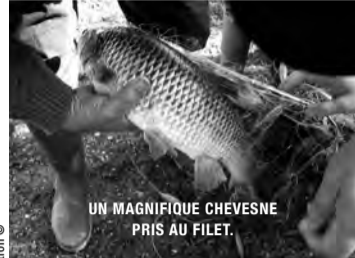
UN MAGNIFIQUE CHEVESNE PRIS AU FILET.

C'est donc dans ce contexte que la fédération lance la procédure de reclassement. Première opération : établir quelles espèces piscicoles vivent dans les plans d'eau. Puis les ingénieurs doivent étudier la possibilité de dériver l'Argence, en « contournant » les retenues. En effet, les thermographes, placés en amont et en aval des trois retenues, montrent qu'à la sortie de la « Mare aux canards », l'eau subissait en période estivale un réchauffement d'environ 6°C ! Avec une eau à 24 ou 25°C, bonjour les dégâts pour les salmonidés !